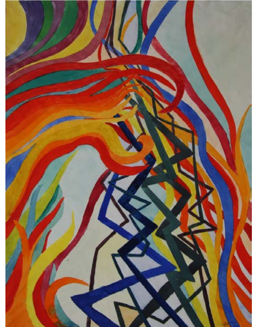
Abb. Vorderseite: „Feurig und kühl“, 60 X 46 cm, Aquarell, 1969