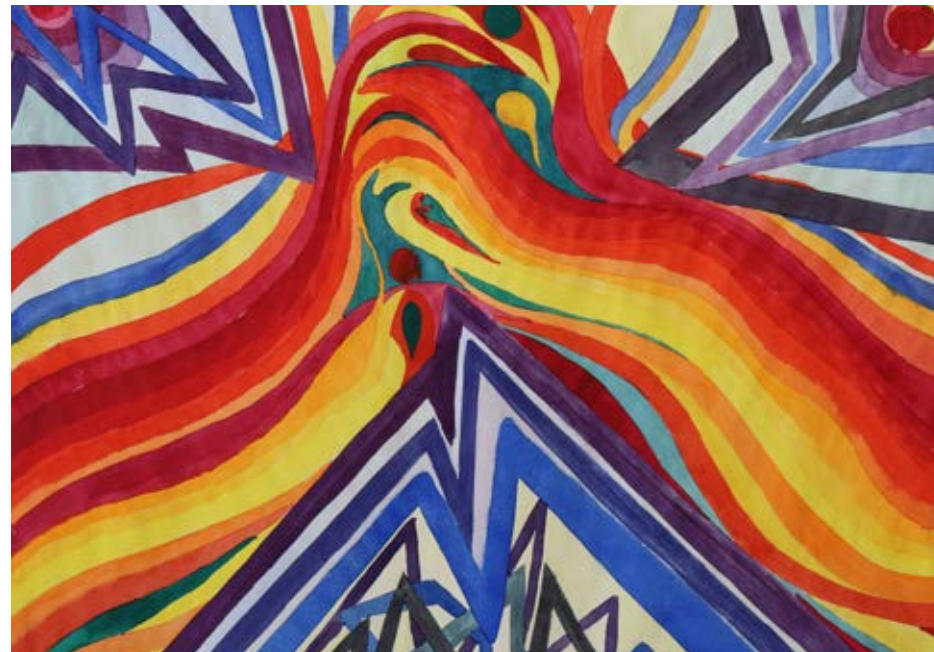
„Sich aufeinander zubewegen und verbinden“, 40 x 60 cm, Aquarell, 1969