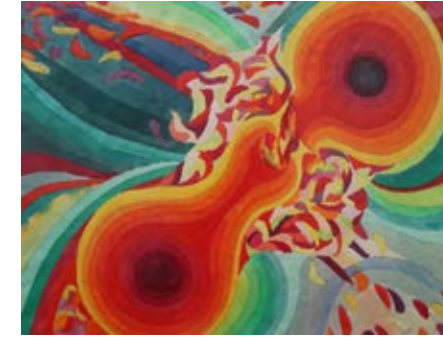
„Zweisamkeit“, 60 x 46 cm, Aquarell, 1969