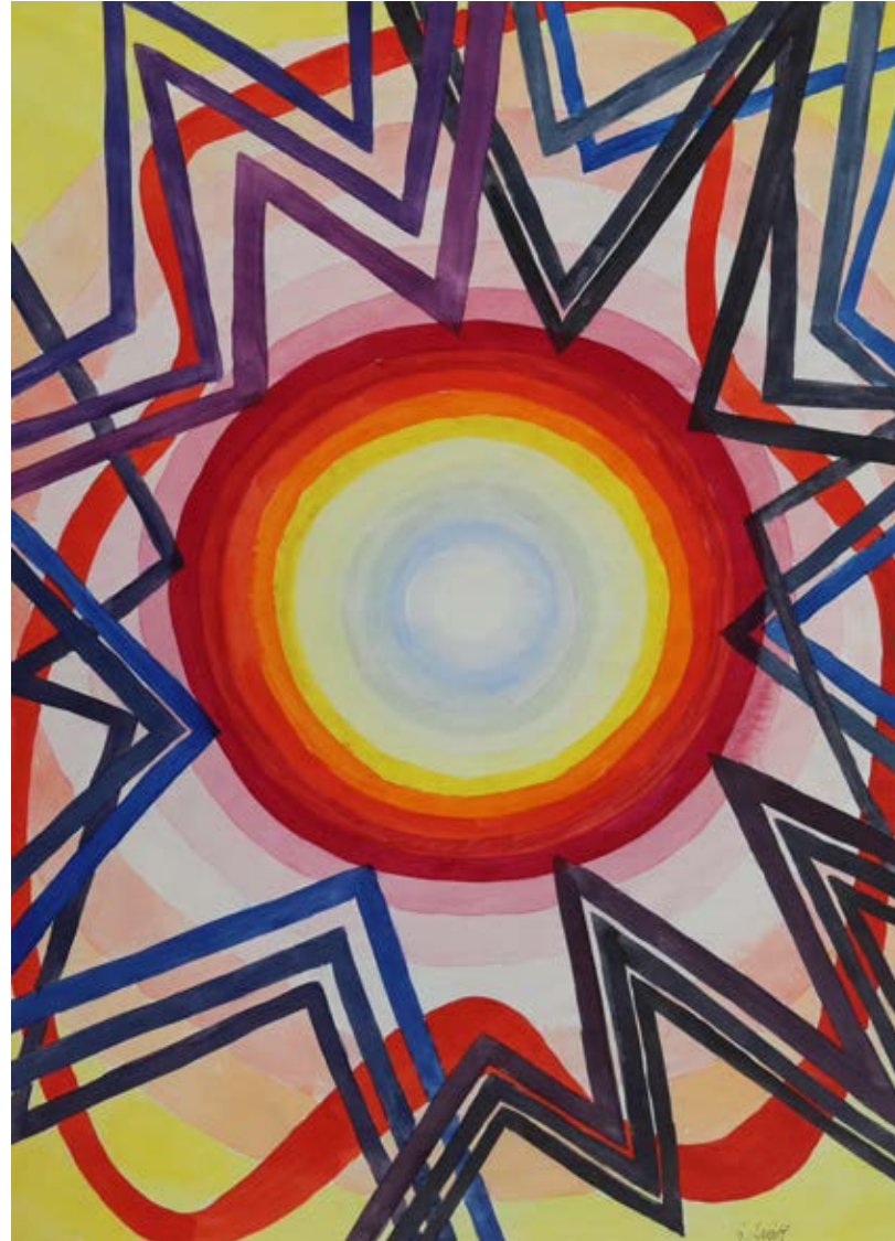
„In sich ruhend _ trotz allem“, 60 x 46 cm, Aquarell, 1969