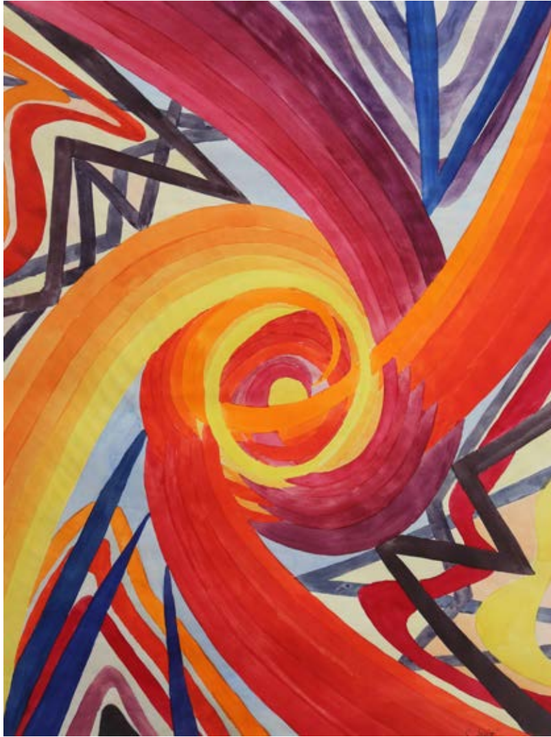
„Energiströme in Balance“, 60 x 40 cm, Aquarell, 1969