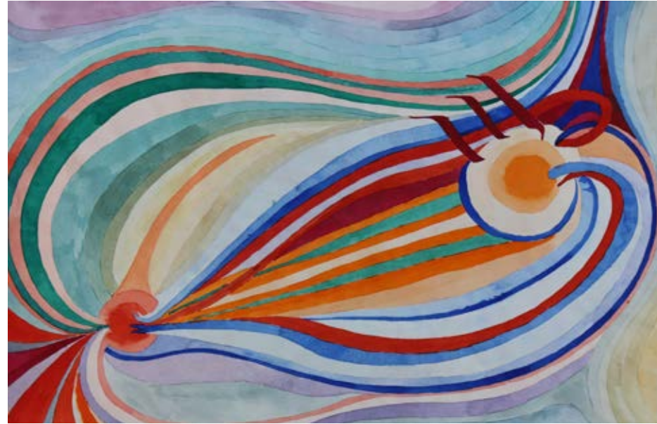
„Gleiche Antennen“, 29,5 x 46 cm, Aquarell, 1969

Gisela Späth, AtelierGalerie Karlsruher Str. 40 | 68766 Hockenheim | Fon 06205-255 7868 gisela.spaeth@freenet.de | www.atelier-spaeth.de