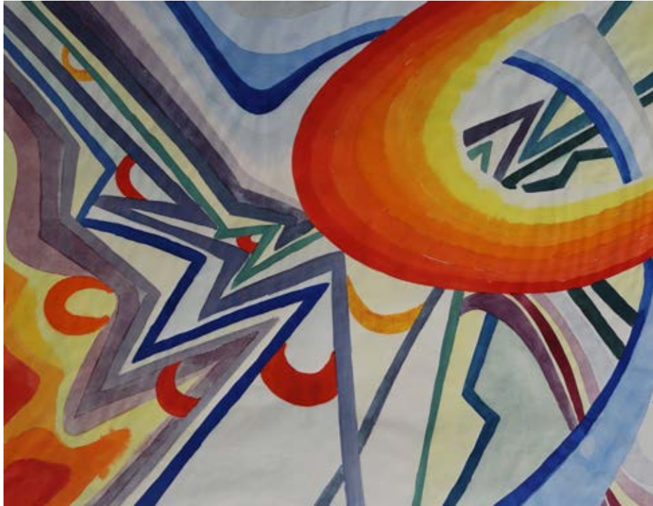
„Mit Energie“, 60 x 46 cm, Aquarell, 1969