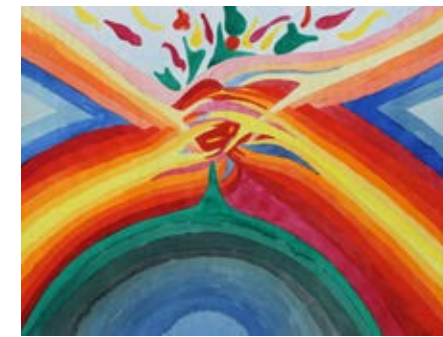
„Hoffnung“, 60 x 46 cm, Aquarell, 1969